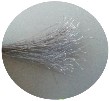
Toma de muestras