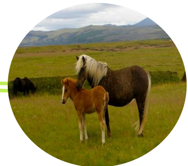
Relaciones de Parentesco

Los procesos de genotipificación y filiación son altamente confiables y reproducibles, tienen carácter legal y corresponden a la única prueba científica disponible para identificar los ejemplares, verificar los pedigrís, corroborar trazabilidad, apoyar el proceso de emisión de certificados, y resolver dudas en caso de animales robados o perdidos.