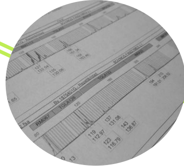
Análisis de alelos