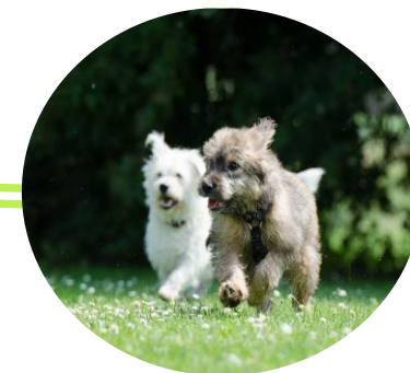
Relaciones de Parentesco

Los procesos de genotipificación y filiación son altamente confiables y reproducibles, tienen carácter legal y corresponden a la única prueba científica disponible para identificar los ejemplares, verificar los pedigrís, corroborar trazabilidad, apoyar el proceso de emisión de certificados, y resolver dudas en caso de animales robados o perdidos.