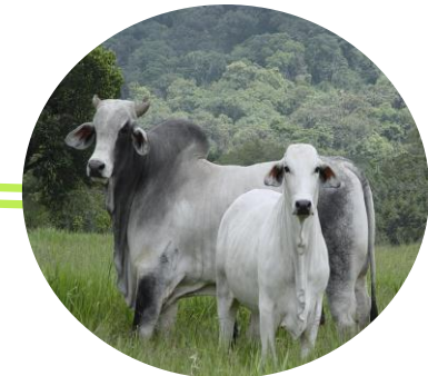
Relaciones de Parentesco

Los procesos de genotipificación y filiación son altamente confiables y reproducibles, tienen carácter legal y corresponden a la única prueba científica disponible para identificar los ejemplares, verificar los pedigrís, corroborar trazabilidad, apoyar el proceso de emisión de certificados, y resolver dudas en caso de animales robados o perdidos.